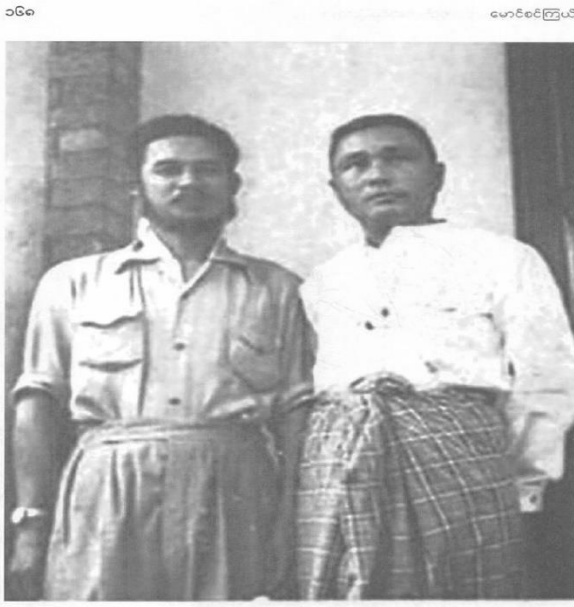
တၢ်အိတ်ဖိန်အူနူးစံးဘန်

-၁၉၄၈ လၢမးရှၢ် (၁၀)သီ KNUကညီဒီကလုာ်စၢဖိန်ကရၢခိန်နတ်ထံာ်လိာ် (ဖဆပလ)ပဒိန်လၢတၢ်ကတဲသကိးကညီကိၢ်အစ့ၢ်.