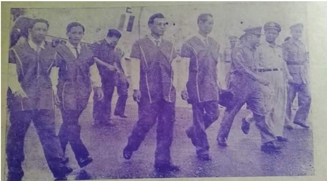
ကေအင်ယူပါတီ၊ မွန်ပြည်သစ်ပါတီ၊ ကရင်နီတိုးတက်ရေးပါတီကိုယ်စား မဟိုကော်မတီဝင်ဗိုလ်မှူးကျင်ဖေဦးစီးသော အဖွဲ့လေယာဉ်ကွင်းမှအဆင်း