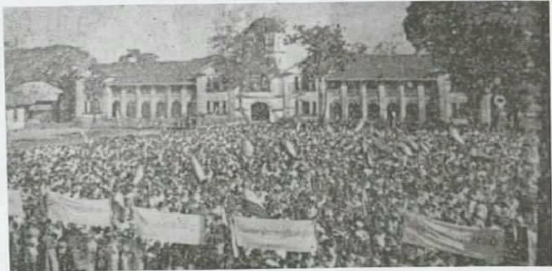
ဝါးဆံဖြူ ကရင်လူထုဆန္ဒ ပြပွဲ